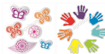
Набор наклеек "Бабочка" 6 элементов в наборе Размеры: 3*3см*3 шт и 2*2 см* 1 шт 6*4см*1 шт