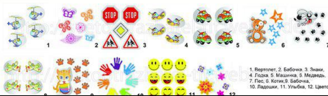
1. Вертолет, 2. Бабочка, 3. Знаки, 4. Лодка, 5. Машинка, 6. Медведь, 7. Пес, 8. Котик, 9. Бабочка, 10. Ладочки, 11. Улыбка, 12. Цветок