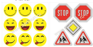
Набор наклеек "Улыбка" 9 элементов 3*3 см*9 шт